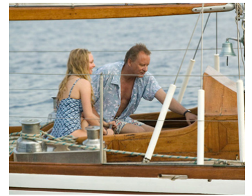
2008 MAMMA MIA ! de Phyllida Lloyd avec Amanda Seyfried