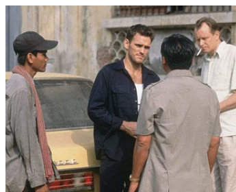
2002 CITY OF GHOSTS de Matt Dillon avec Kem Seveyvuth, Matt Dillon