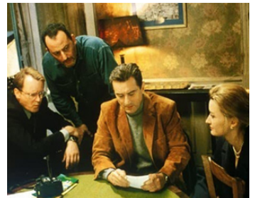
1998 RONIN (Ronin) de J. Frankenheimer avec Jean Reno, Robert De Niro, Natascha McElhone