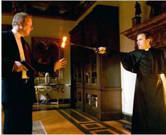
2009 ANGES ET DÉMONS (Angels & Demons) de Ron Howard avec Ewan McGregor