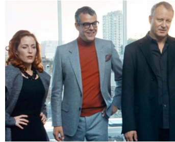
2009 BOOGIE WOOGIE de Duncan Ward avec Gillian Anderson, Danny Huston