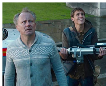
2015 AVENGERS, L'ÈRE D'ULTRON (Avengers, Age of Ultron) de Joss Whedon avec J. Howard