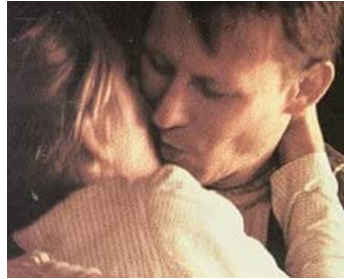
1991 OXEN (Oxen) de Sven Nykvist avec Ewa Fröling