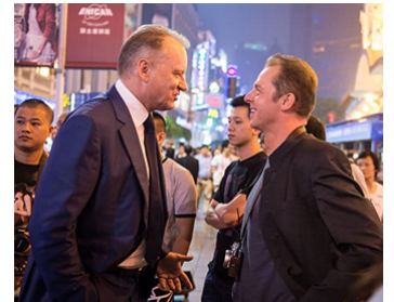
2014 HECTOR ET LA RECHERCHE DU BONHEUR (Hector...) de Peter Chelsom avec Simon Pegg