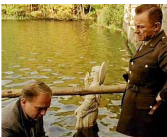
2001 LE CAS FURTWÄNGLER (Taking Sides) d'Istvan Szabo avec Harvey Keitel