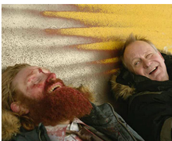
2014 REFROIDIS (Kraftidioten) d'Hans Petter Moland avec Kristofer Hivju