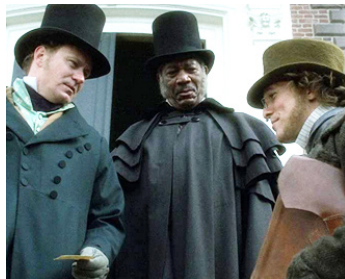
1997 AMISTAD (Amistad) de Steven Spielberg avec Morgan Freeman, Matthew McConaughey