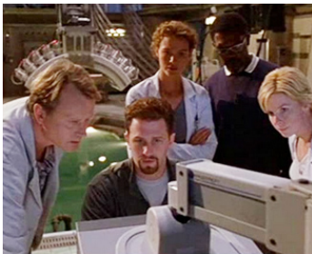
1999 PEUR BLEUE (Deep Blue Sea) de R. Harlin avec Michael Rapaport, Jacqueline McKenzie