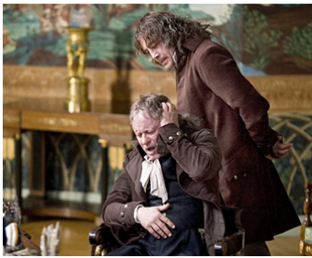
2006 LES FANTÔMES DE GOYA (Goya's Ghosts) de Milos Forman avec Javier Bardem