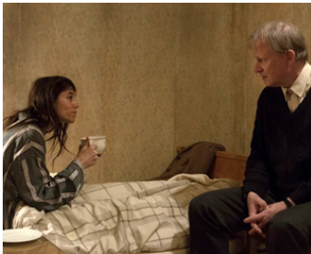
2013 NYMPHOMANIAC (Nymphomaniac) de Lars von Trier avec Charlotte Gainsbourg