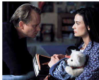
2000 D'UN RÊVE À L'AUTRE (Passion of Mind) d'Alain Berliner avec Demi Moore