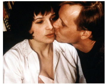
1988 L'INSOUTENABLE LÉGÈRETÉ DE L'ÊTRE de Philip Kaufman avec Juliette Binoche