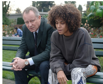
2010 FRANKIE ET ALICE (Frankie & Alice) de Geoffrey Sax avec Halle Berry