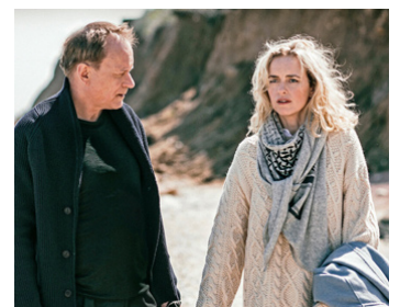
2017 RETOUR À MONTAUK (Rückkehr nach Montauk) de V. Schlöndorff avec Nina Hoss