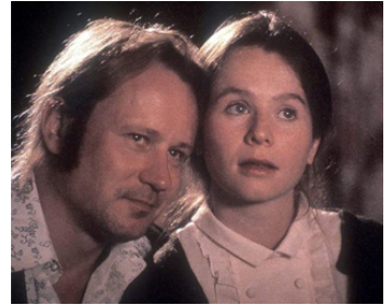
1996 BREAKING THE WAVES de Lars von Trier avec Emily Watson