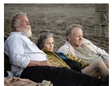
2020 LAST WORDS de Jonathan Nossiter avec Nick Nolte, Charlotte Rampling