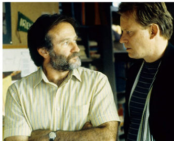
1997 WILL HUNTING (Good Will Hunting) de Gus Van Sant avec Robin Williams