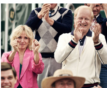
2017 BORG McENROE (Borg/McEnroe) de Janus Metz Pedersen avec Tuva Novotny