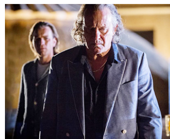
2016 UN TRAITRE IDÉAL (Our Kind of Traitor) de Susanna White avec Ewan McGregor