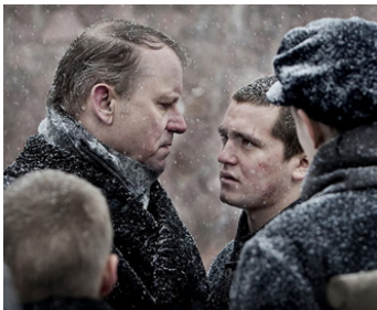
2010 LES RÉVOLTÉS DE L'ÎLE DU DIABLE (Kongen av Bastøy) de Marius Holst avec Benjamin Helstad