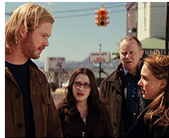
2011 THOR (Thor) de Kenneth Branagh avec Chris Hemsworth, Kat Dennings, Natalie Portman