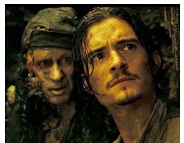
2006 PIRATES DES CARAÏBES : Le Secret du coffre maudit (Dead Man's Chest) de G. Verbinski avec O. Bloom