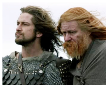
2005 BEOWULF, LA LÉGENDE VIKING (Beowulf & Grendel) de S. Gunnarsson avec Gerard Butler