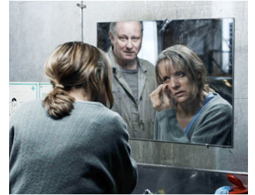
2010 UN CHIC TYPE (En ganske snill Mann) de Hans Petter Moland avec Jannike Kruse