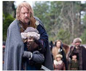
2007 ARN, CHEVALIER DU TEMPLE (Arn, tempelriddaren) de Peter Flinth