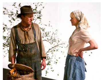
2003 DOGVILLE (Dogville) de Lars von Trier avec Nicole Kidman