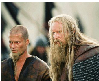
2004 LE ROI ARTHUR (King Arthur) d'Antoine Fuqua avec Til Schweiger