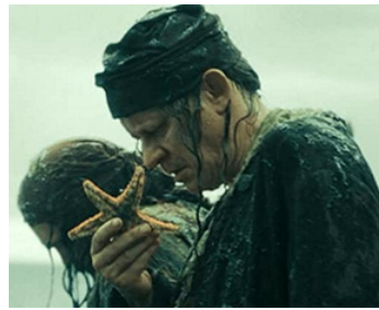
2007 PIRATES DES CARAÏBES : Jusqu'au bout du monde (At World's End) de Gore Verbinski