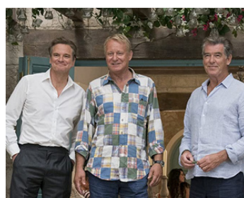
2018 MAMMA MIA ! HERE WE GO AGAIN d'Ol Parker avec Colin Firth, Pierce Brosnan