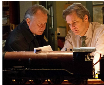
2013 LES VOIES DU DESTIN (The Railway Man) de Jonathan Teplitzky avec Colin Firth