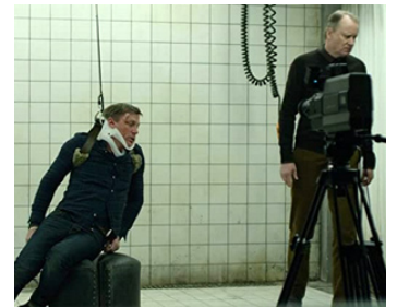
2011 MILLÉNIUM (The Girl with the Dragon Tattoo) de David Fincher avec Daniel Craig