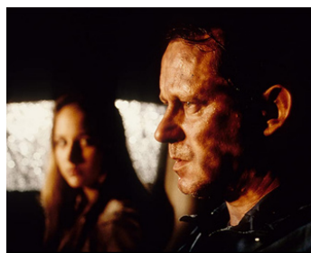
2001 LA PRISON DE VERRE (The Glass House) de Daniel Sackheim avec Leelee Sobieski