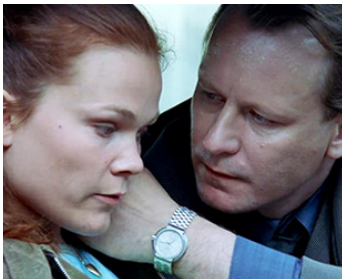
1997 INSOMNIA (Insomnia) d'Erik Skjoldbjærg avec Marianne O. Ulrichsen