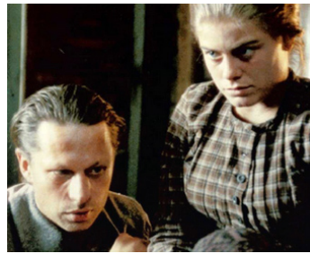
1986 LE CHEMIN DU SERPENT (Ormens väg på hälleberget) de Bo Widerberg avec Stina Ekblad