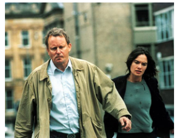
2000 ABERDEEN (Aberdeen) de Hans Petter Moland avec Lena Headey